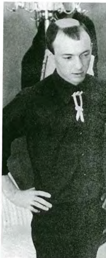
Die Monks haben auch das Konzept der uniformen A

»Wir fanden die Platte grandios. Das war am Anfang unser Antrieb. Sie hat sich so unterschieden von allen anderen Sachen der Zeit, dass wir es lohnenswert fanden, genauer hinzusehen«, sagt Post. »Wir wollten aber auch das kulturelle Phänomen aufdecken: dass fünf junge Amerikaner nach Deutschland kommen, dort kleben bleiben, einfach als Musiker herumtingeln und